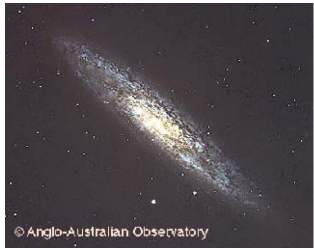
図 1 可視光で見た NGC253

NGC253 は太陽系から 2.5Mpc の位置にある、わが銀河の近傍銀河である (彫刻室座群)。その可視光による写真を図 1 に示す。